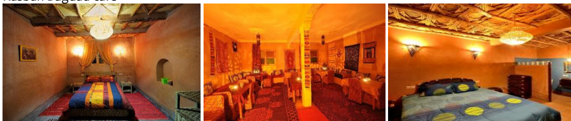
Kasbah Bagdad café